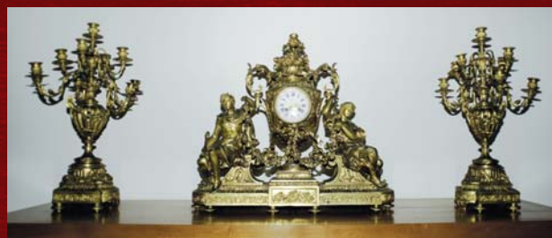
Interno della Biblioteca

Nella Collana della «Cattedra per l'Arte cristiana di Sicilia - Rosario La Duca» è stato pubblicato il volume: