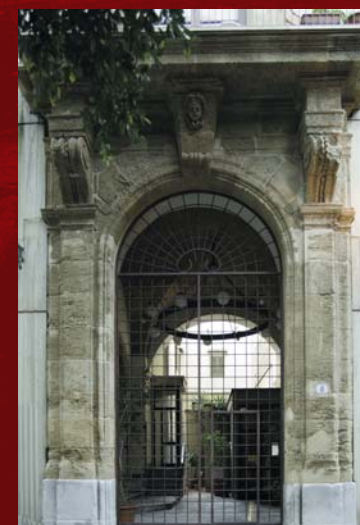
Ingresso della Biblioteca - Via Regia Zecca, 8

Il Fondo bibliotecario "Rosario La Duca" è parte integrante della Biblioteca della Facoltà Teologica. Esso è frutto del sapiente lavoro di ricerca dello Studioso, che raccolse con attenzione testimonianze librerie, archivistiche e topografiche: alle monografie ed ai documenti si aggiungono collezioni letterarie, grafiche e fotografiche che privilegiano la storia e la cultura di Sicilia.