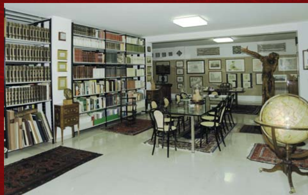
Interno della Biblioteca